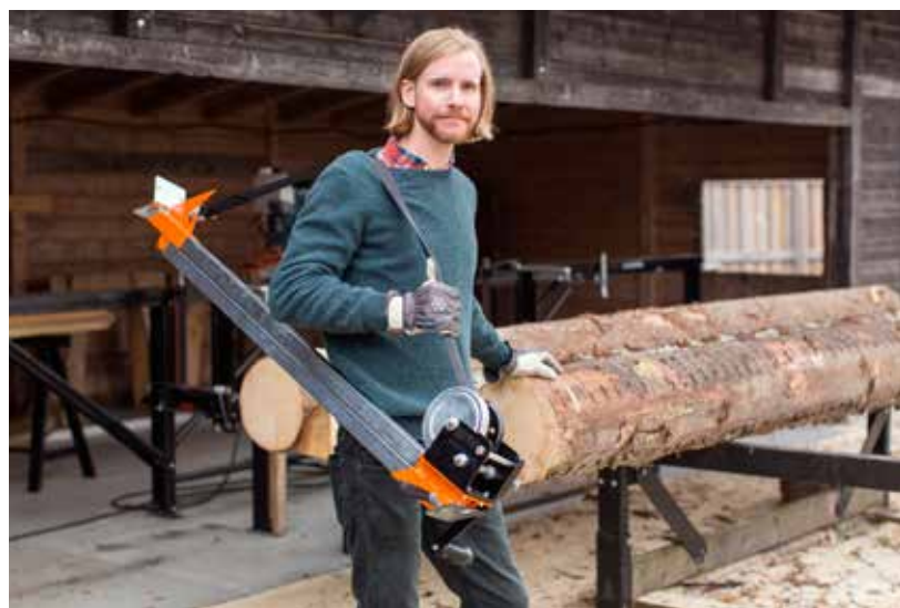
• Der neue Holzknecht (Stammheber und Fällrichter) kann auch auf dem Rücken getragen werden.

ren, profilieren und hobeln. „Mit diesem neuen Zubehör braucht man sich keine Sorgen mehr zu machen. Diese Maschine ist die perfekte Ergänzung für jeden Sägewerker und Holzhandwerker“, so Bengt-Olov Byström.