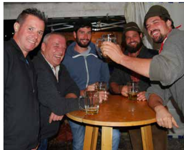
• Gute Stimmung herrscht in abendlich trauter Runde im großen Messezelt.