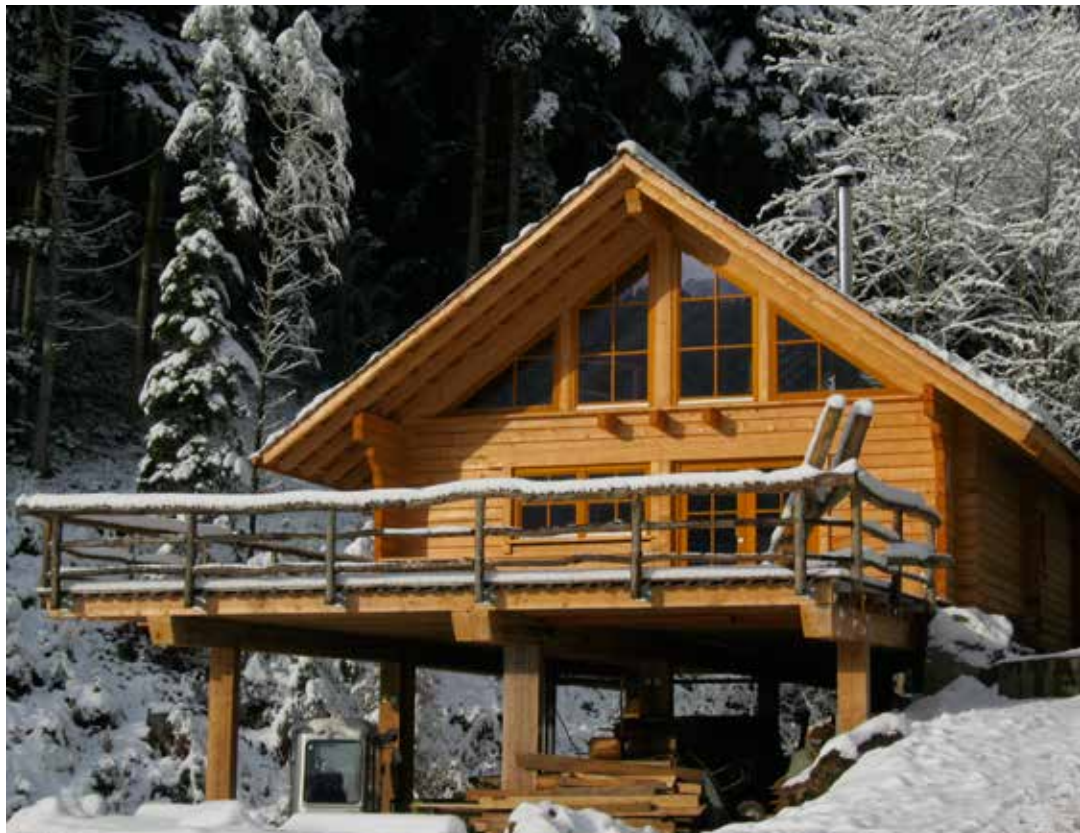
• Für dieses zweite, größere Blockhaus hat Markus mit der Schablone nur halb soviel Zeit benötigt.

und weniger beschwerlich. „Mit immer demselben Maß kann ich bequem am Boden arbeiten, jeder Balken ist identisch und ich brauche zudem auch weniger Platz, da ich ohne Abbundplatz arbeiten kann“, fügt Markus hinzu. Meinen ersten Prototyp einer Blockhausschablone wollte ich dann gleich an diesem zweiten Blockhaus für Michael Reimold testen. Und tatsächlich, es funktionierte.