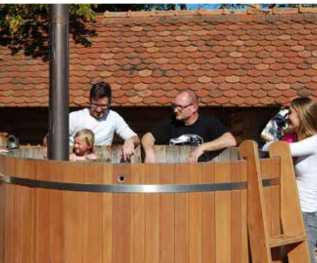
• Der beheizbare Badezuber „Kit“ lud am Nachmittag auch die ganz Kleinen zu einem Bad ein.