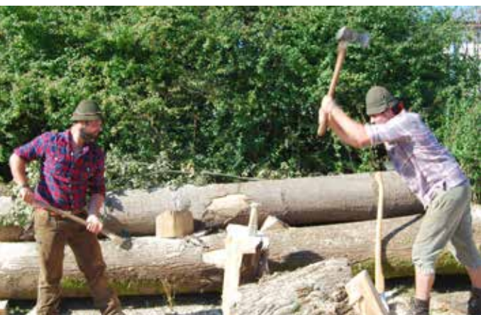
• Traditionelles Äxteschwingen im Wechselrhythmus, um einen Stamm zu spalten.