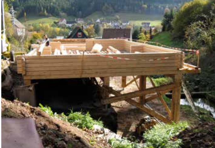
• Das Erstlingswerk konnte mit der Blockhausschablone schnell aufgebaut werden, alle Eckverbindungen haben perfekt gepasst.