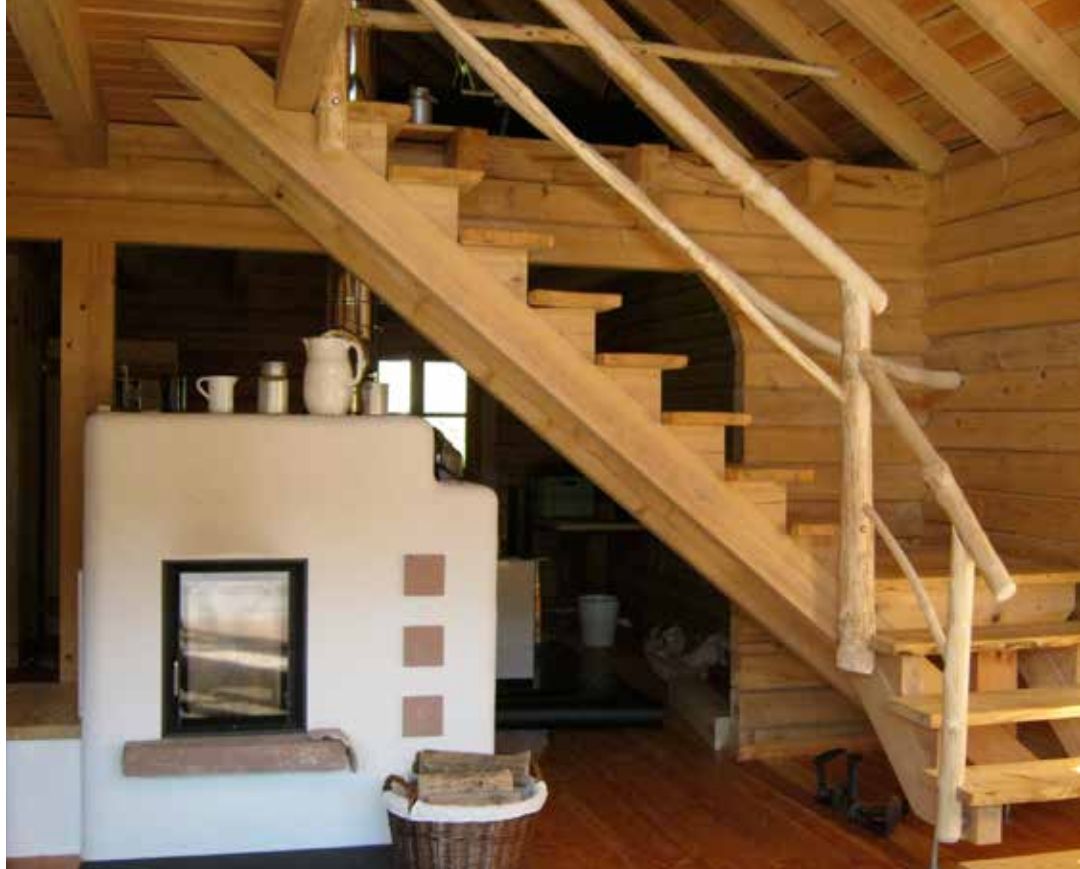
• Auch den Innenausbau des Schwarzwald-Blockhauses hat Markus Merkle stilgetreu gefertigt.