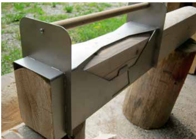
• Die Blockhaus-Schablone mit massivem Holzgriff ist grat- und oxidfrei, lasergeschnitten sowie hochwertig verschweißt.