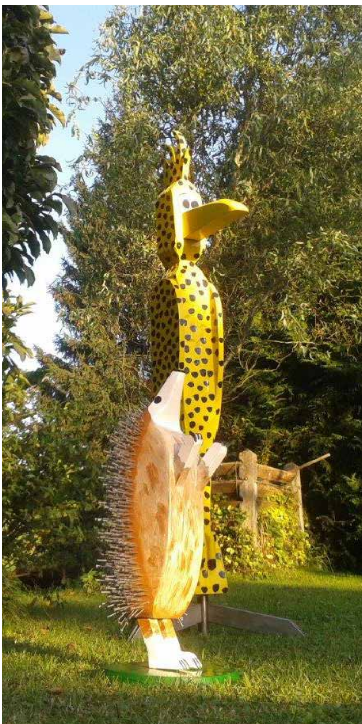
Leisten sich im heimischen Garten in Bergatreute Gesellschaft: Nagel-Igel und Leoparden-Papagei.