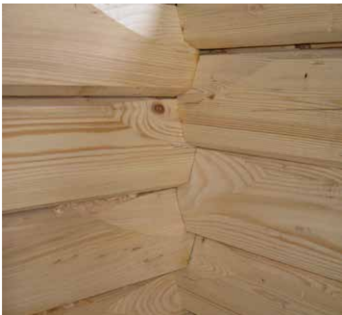
• Eckverkämmungen mit der Blockhausschablone passen immer perfekt und in allen Lagen. Die Setzung ist bereits eingerechnet.