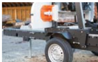
• Smartes system wo die Kotflügel als Sperre für das Sägekopf beim Transport dienen.

Ein großer Vorteil mit B1001 ist, dass die Laufschiene bzw. das Sägebett so stark und steif ist, dass sechs Stützbeinen für die Stabilität reicht. Die Stützbeinen sitzen auf der Innenseite des Sägebettes, die Kotflügel kann abmontiert werden und die Deichsel kann beim Sägen eingeschoben werden. Somit ist nichts im Weg beim Sägen.