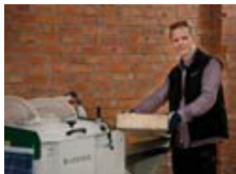
SH410 wird zum Bestseller. Besonders bei unseren bestehenden Logosolkunden.