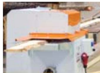
Mit der Doppelbesäumer erhält unsere Kunden jetzt eine Maschine, die die Baumkante der Bretter effizient absägt.