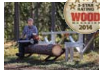
Farmer's Sawmill wird vorgestellt und wird sofort ein Erfolg.