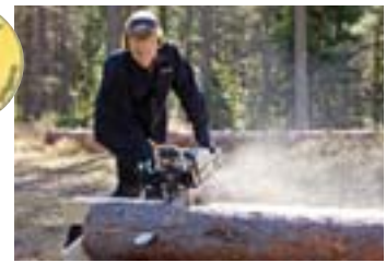
Der Timberjig kam. Der wurde bald das meist verkaufte Produkt im Sortiment!