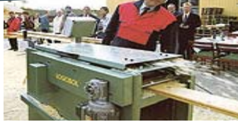
Der ersten Logosolhobel wird präsentiert und Logosol erhält Wachstumspreis vom Industrieminister.