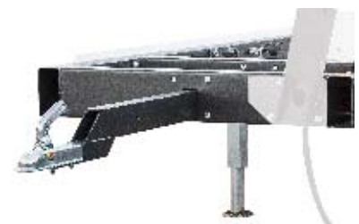
• Deichsel mit zwei Positionen. Beim Sägen wird die einfach eingeschoben.

Ein mobiles Sägewerk hat viele Vorteile auch wenn Du zu Hause am Hof bleiben. Das Sägewerk kann z.B. zur Aufbewahrung reingenommen werden, fürs Reinigen verschoben werden, oder auch wenn neue Stämme mit dem Radlader auf dem Holzstapel geladen werden müssen.