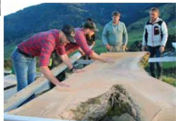
• Alle sind begeistert von der Maßgenauigkeit und Oberfläche der schönen Schnitte mit dem Big Mill.

FÜR EIN ALPENLÄNDISCHES SÄGESPEKTAKEL MIT DEM BIG MILL REISTE DER LOGOSOL-FIRMENGRÜNDER PERSÖNLICH AN