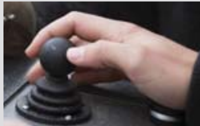
• Die digitale Sägewerksteuerung „Smart-Set“ ist mit der Bediener im Fokus entwickelt.

Das neue Smart Set ist ein weiterer großer Schritt für Logosol und unsere Kunden. Mit einer intelligenten Software und viele Voreinstellungen arbeitest Du beim Sägen schnell, einfach und effizient.