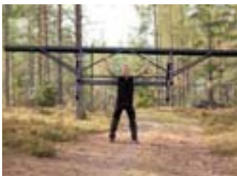
Premiere für das Sägewerk M8 welches in enger Zusammenarbeit mit Sägewerkskunden auf der ganzen Welt entwickelt wurde.