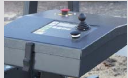
• Von der elegante Bedienerpult steuerst Du das Sägen mit Softwareunterstützung.