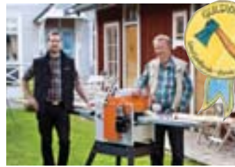
Der Variohobel SH230 wird schnell zum Favorite bei vielen Logosoler.