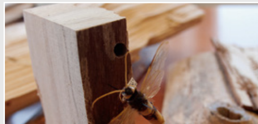
• Vedstekelns larver överlever sågning och torkning.