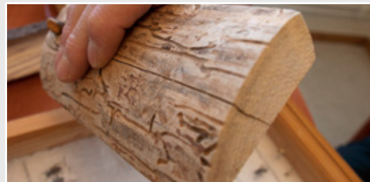
• Det är normalt bara ytveden som skadas av barkborren.

Det finns alltså goda skäl att snabbt ta hand om skadade träd. Och att själv förädla virket för att få större nytta av det än som brännved.