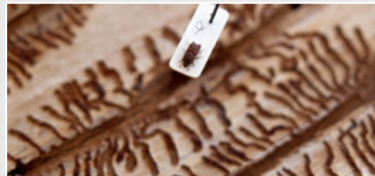
• Barkborren med spåren i barken som den lämnar.