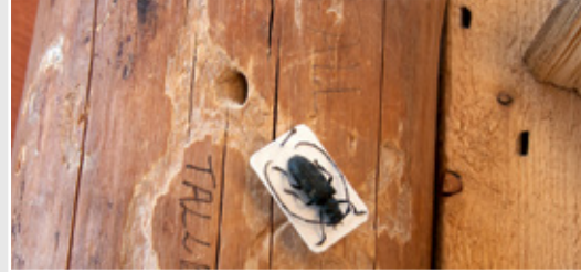
• Tallbocken gör stora hål i tall och gran.