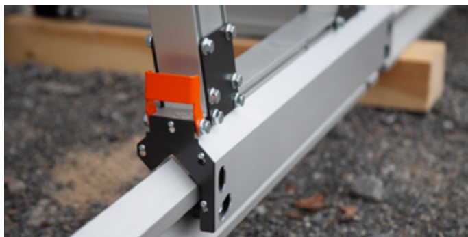
Såghuvudet flyter fram lätt på rälsen, helt glappfritt.