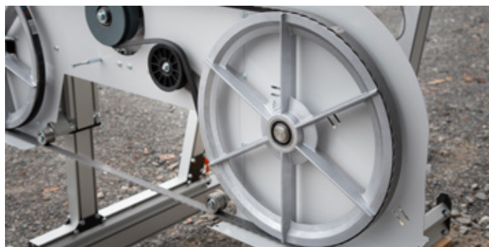
Bandhjul med fläktvingar, kyler och håller rent.

B701 är ett så kallat "low tech"-sågverk i ordets bästa bemärkelse. Konstruktionen är enkel att förstå, logisk att använda och byggd för att hålla. Med få saker som kan krångla blir ägandet smidigt och det bara fungerar, år efter år.