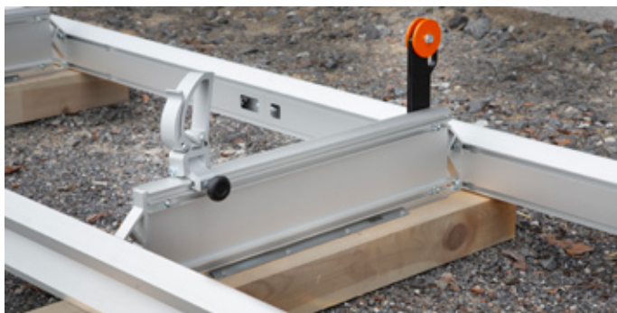
Kraftig stockhylla med bred anläggningsyta mot stocken.