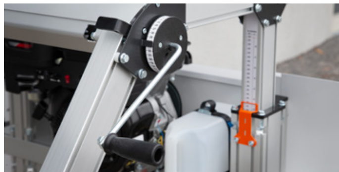
Skön känsla i veven, inställningen går snabbt och utan ansträngning.